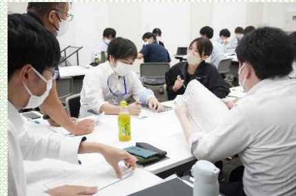
【活性化コミュニケーション研修の様子】