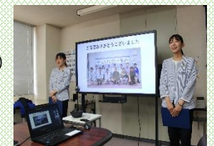
【若手女性による研修報告】

令和 5 年度に 2 名の女性が技術職として採用されており、「女性の採用人数を 1 人以上増加させる」という目標を達成している。管理職に占める女性労働者の割合 4.3% (産業分類「建設業」の国の平均 3.1%) 女性活躍推進企業 (えるぼし) (厚生労働大臣認定) 3つ星認定 (令和 3 年度)