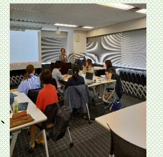
【女性役職者ワーキングの様子】

次期役職候補者向け選抜研修や女性役職者コミュニティ(ワーキング)、ダイバーシティカフェの実施、公認資格や通信教育の受講費補助など、従業員の能力活用に関する取組みを行っている。女性活躍推進企業 (えるぼし) (厚生労働大臣認定) 3つ星認定 (令和 4 年度)