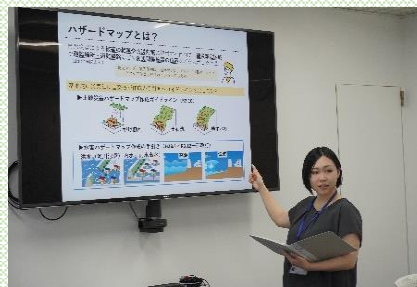
【女性技術者活躍の様子】