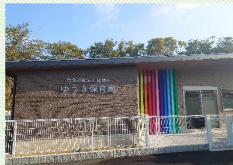
【企業主導型保育園「ゆうき保育園」】