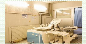
【業務改善のため導入した福祉器具】

女性活躍推進法に基づく一般事業主行動計画 (従業員 100 名以下は任意) を任意策定しており、「従業員全体の残業時間 (平均) を 2 年で 5%、5 年で 10%削減」という目標を達成している。管理職に占める女性労働者の割合 56.3% (産業分類「医療・福祉」の国の平均 41.8%) 女性活躍推進企業 (えるぼし) (厚生労働大臣認定) 3つ星認定 (平成 30 年度)